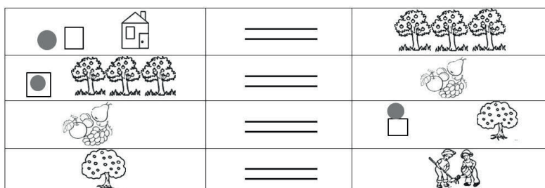
Рисунок 3 — Сенсорно-графическая программа «Фруктовый сад»

Приемом, обеспечивающим наглядный показ правил смысловой связи предложений в повествовательном типе рассказа, была принята денотативно-графическая схема в виде предметно-подстановочной таблицы разработанная В.К. Воробьевой [2]. Таблица представляет собой ряд горизонтальных строчек-предложений, каждая из которых обозначает отдельную мысль. Кадры программы заполняются условным предметным кодом мысли: субъект и объект. В структуре конкретной визуальной символической программы они заполняются или предметными карточками, символическими обозначениями, или словами, например, составление рассказа «Фруктовый сад»: «У дома растет сад. В саду зреют фрукты. Фрукты растут на фруктовых деревьях. Фруктовые деревья поливают и рыхлят садоводы» (см. рисунок 3).